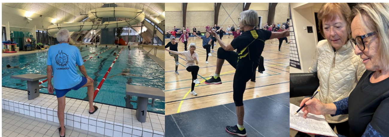
Frivillige i RÆM har mange forskellige funktioner

Selv om en del medlemmer er frivillige, er det ikke nogen hemmelighed, at vi har brug for langt flere frivillige til aktiviteterne. Enkelte gange har vi stået i den situation, at en aktivitet har måttet lukke, fordi der ikke var en frivillig til at tage over.